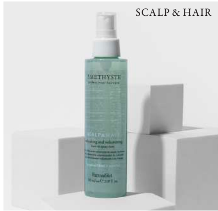
SCALP & HAIR